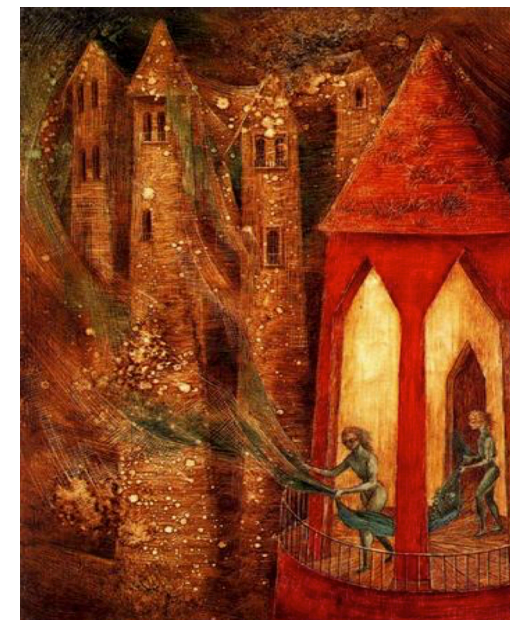
Remedios Varo (1955), La tarea

Coordinación de Investigación y Posgrado FCA e I.