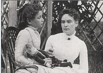
Helen Keller y Anne Sullivan

“Se puede afirmar que una persona es sordo-ciega cuando siendo ciega o deficiente visual también es sorda o deficiente auditiva” (Fundación ONCE).