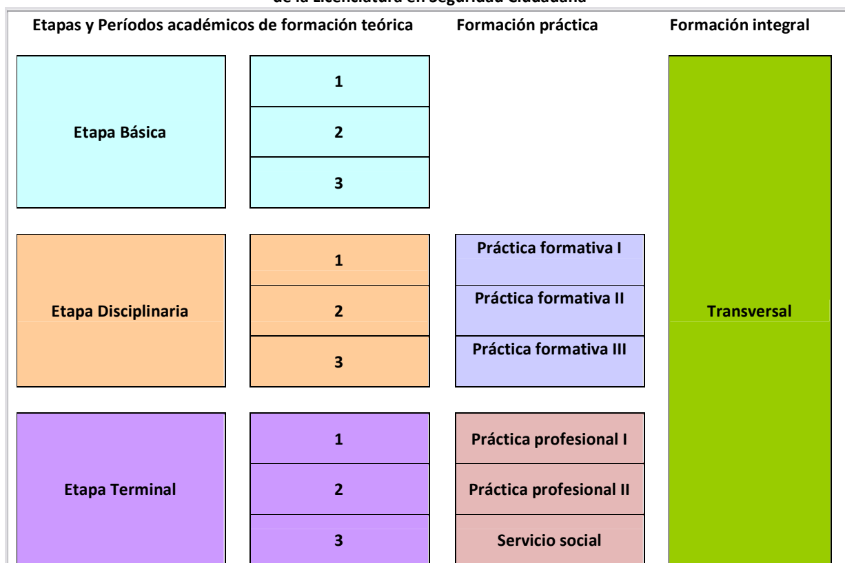
Fig. 2.- Esquema del modelo de formación de la Licenciatura en Seguridad Ciudadana