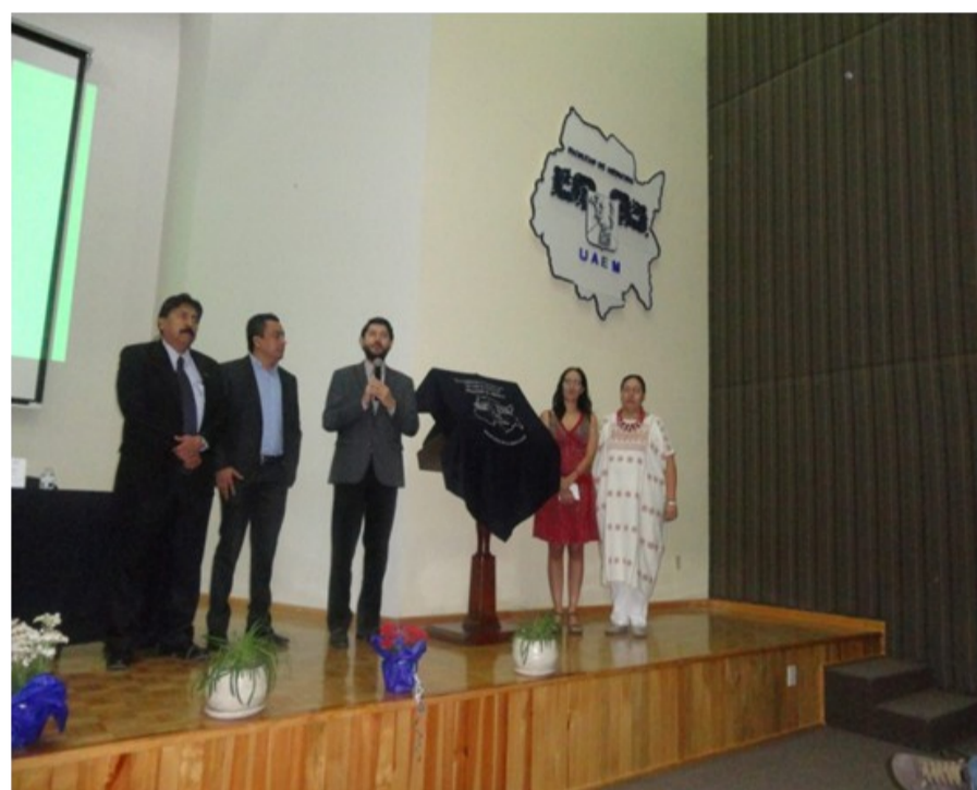
Develación de la placa del laboratorio de fisiología "Dr. Gregorio Sosensky"