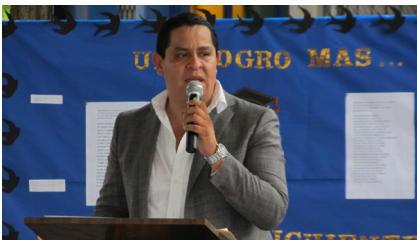
El Diputado Juan Ángel Flores Bustamante, además padrino de la generación saliente, comentó que todos ellos son “un ejemplo para sus familias, un ejemplo para sus hijos que los enmarca en un cuadro de honor, de perseverancia, de trabajo y de organización”.

Finalmente dio por clausurado el evento: “siendo el día viernes 6 de septiembre de 2013 y las 18 horas con 35 minutos doy por clausurado evento de ceremonia de graduación de la generación 2013 muchas felicidades a todos los graduados y a todas sus familias, en hora buena”.