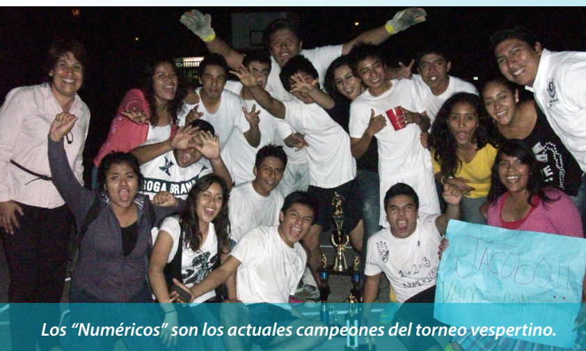
Los “Numéricos” son los actuales campeones del torneo vespertino.

El propósito de futbolín prepa es que al término de un día de clases contemos con una actividad para quitarnos el estrés, para convivir con los amigos, para conocer nuevos amigos y qué más que un partido de futbol, haciendo a un lado los problemas y disfrutar este deporte, de tu afición que te apoya y tener esa maravillosa sensación de meter un gol; de ver como un portero se luce en sus tajadas o se vence ante un tiro maestro, de cómo el defensa te roba el balón, impidiéndote la gloria; de sentir el nerviosismo por una tanda de penales, de sonreír en un partido por el simple placer de jugar al futbol; todos somos futbolín prepa.