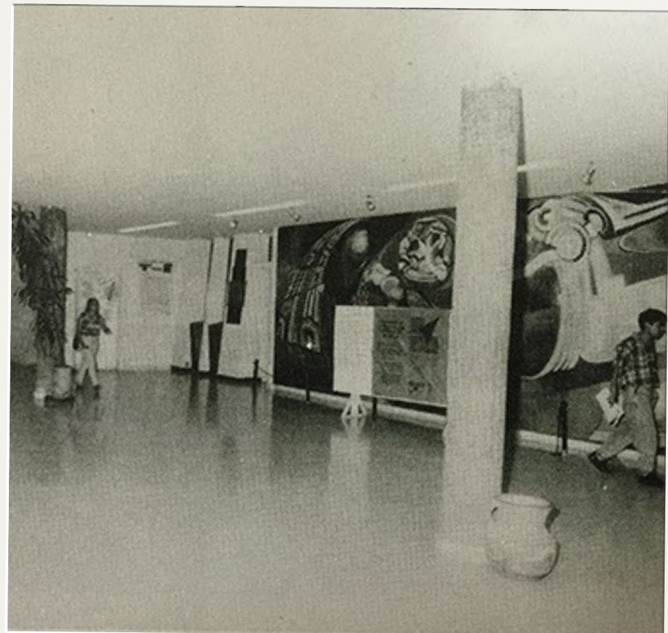
Se funda en el año de 1953

"Oh crisol del alma de mi raza oh joven flechadora de los cielos, serás eterna fé, luz y esperanza Universidad Autónoma de Morelos"